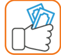
Formación en fórmulas de financiación

Contar con el apoyo del órgano de gobierno de UNAD es clave para que se pueda establecer una estrategia conjunta.