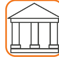
Interlocución con la Administración