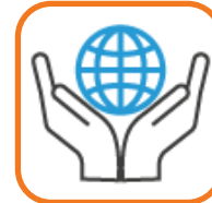
Trabajo conjunto de las entidades