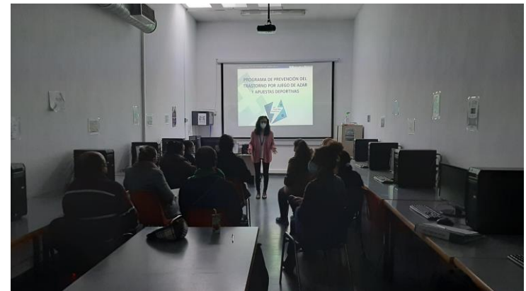
Sesiones a familias